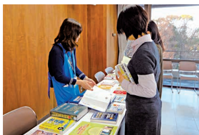
司書による資料・情報サポートの様子