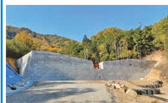
福田地区砂防堰堤本体

砂防堰堤とは、土石流などの土砂を受け止めたり、かけ崩れを防いだりする施設です。これまで福田地区と馬木地区は、定められた基準より早い段階で避難情報を発令する、暫定運用特別基準を適用していましたが、砂防堰堤本体の完成に伴い、12月15日に解除しました。しかし、災害は、想定を上回る被害を及ぼす恐れがありますので、災害への備えを引き続きお願いします。