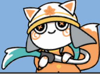
広島市消防局マスコット キャラクター「もみみん」

令和2年に、区内で発生した13件の火災のうち、こんろやたばこなどが原因 の住宅火災が半分以上を占めています。