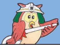
東消防署マスコットキャラ クター「ふくちゃん」

11月9日(119番の日)から15日まで、秋季 全国火災予防運動が実施されます。 コロナ禍で「おうち時間」が増えているこの機会に、家 庭でできる防火対策についてチェックリストで確認し、 家庭での火災を予防しましょう! 東消防署予防課(☎263-8401、☎263-7489)