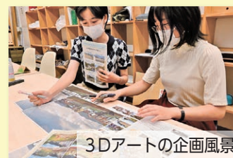
3Dアートの企画風景

車窓からのシャッターチャンスは一瞬かも!? 時間のあるときに、駅で降りて近づいて見るのもお勧めです。お見逃しなく!