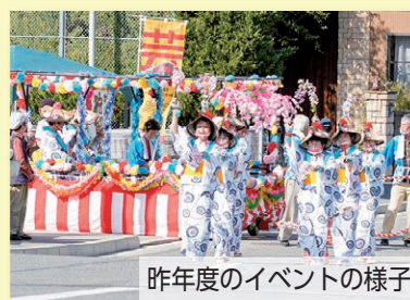
昨年度のイベントの様子

昨年11月1日、芸備線の全線運転再開1周年を記念した「芸備線おもてなしイベント」を狩留家駅、向原駅(安芸高田市)、三次駅(三次市)、備後庄原駅(庄原市)の4駅で同時に開催。多くの人が各駅を訪れる賑わいを見せました。今年度も他市3駅と、区内では井原市駅で10月23日(土)の開催を目指して準備中です。