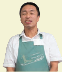
かこがわ 図書館職員 水主川主幹

読書週間にちなみ、市立図書館全館で「ひろしま図書館まつり」を開催します。 安芸区図書館では、「本の交換市」と「福ブック」をこの図書館まつりの期間中だけ行います。 皆さんが読書を始めたり、より楽しんだりするためのきっかけになればと思います。