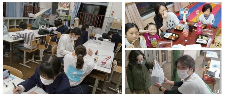
①学習支援の様子、②各家庭ごとの食事支援(写真はご家族のもの)、③各家庭へ弁当を配布する団体スタッフ

【申込方法】各実施団体(下表)へお問い合わせください。各実施団体で各日14人程度