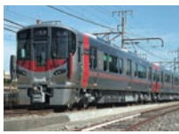
市内の公共交通の1日当たりの利用者数

新型コロナウイルス感染症の拡大に伴う外出自粛などの影響で、公共交通の利用者が減少しています。昨年度の1日当たりの利用者は、コロナ禍前の一昨年度に比べて約3割減少しており、公共交通事業者に、深刻な影響が及んでいます。