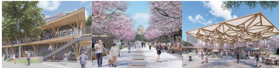
公園との調和を高める木造店舗(民営施設)