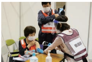
ワクチン接種シミュレーション(4/4)

入院している高齢者などから優先的に接種し、ワクチンの供給状況に合わせて順次接種を拡大していきます。最新の接種スケジュールなどについては、本紙や市ホームページなどで随時お知らせします。