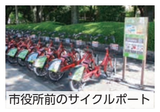
市役所前のサイクルポート