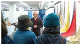
「草木染の世界」展ギャラリートーク