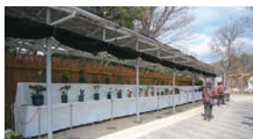
クリスマスローズ展