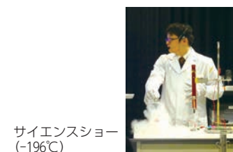
サイエンスショー (-196℃)