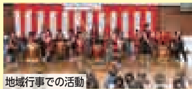
地域行事での活動