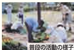
普段の活動の様子

町内のつながりをつくるために、亀崎第三公園を活用して花づくりを始めました。現在は会員13人で、種から花を育てる活動を月に1回行うとともに、花壇への水やり、草取り、施肥などの管理を行っています。花づくりは失敗もありますが、手をかけて育て、きれいな花が咲いてくれたときは、喜びを感じます。これからも花づくりを通してつながりの輪を広げ、町内の交流を楽しみながら続けていければと思います。