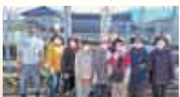
代表の数本さん(写真左)と会員のみなさん

平成28年から亀山第一公園で花壇づくり活動を行っています。会員メンバーが月に2回程度集まり、花壇の花を年中切らさないよう、お互い無理をしないのできる範囲で活動しています。この冬は、ハボタンやパンジーを植えました。花壇を見た人が花を持って来てくださることもあり、公園を通る人が花壇を見て喜んでくれることが励みになっています。もっと賛同者の輪を広げて、活動を続けていきたいと思っています。