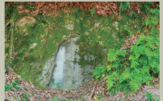
横穴防空壕(第二検疫所)