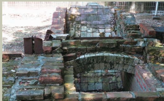
馬匹焼却炉(馬匹検疫所) (現・似島臨海少年自然の家)