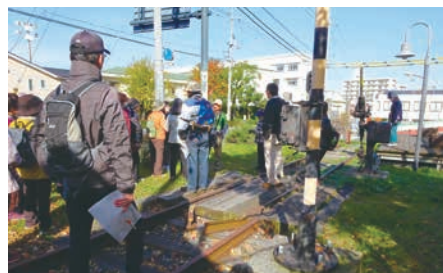
旧国鉄宇品線跡地の線路モニュメントの見学

楽しく歩きながら、南区の豆知識を増やしていきませんか。一緒に「まちあるき」を楽しむメンバーを募集しています。興味のある人は、地域起こし推進課(☎250-8935、☎252-7179)まで。