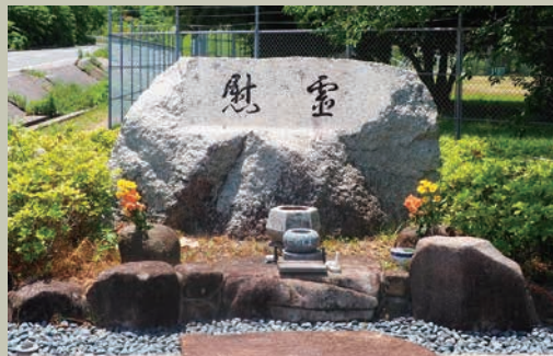
慰霊碑(馬匹検疫所) (現・似島中学校)

者を上陸させるために、前述の棧橋が使用され、棧橋は被爆者で溢れ、20日間で約1万人の被爆者が運び込まれ、壮絶な野戦病院となりました。