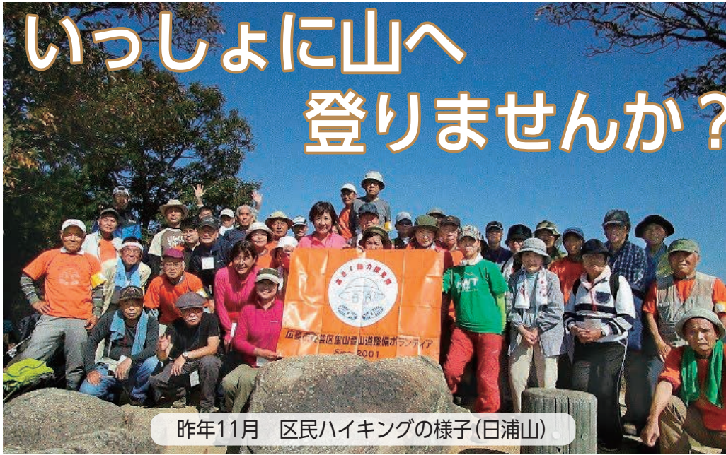
昨年11月 区民ハイキングの様子(日浦山)

P7・P8編集・安芸区役所区政調整課 〒736-8501 安芸区船越南三丁目4-36 ☎821-4903 ☎822-8069