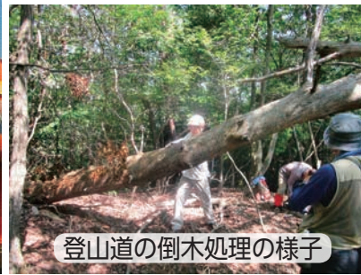
登山道の倒木処理の様子