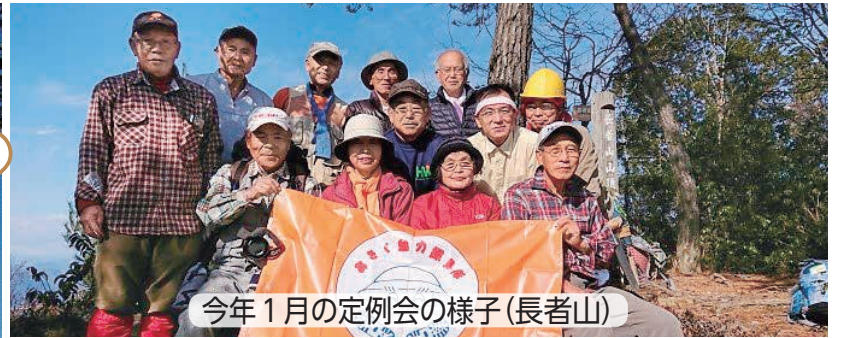
今年1月の定例会の様子(長者山)