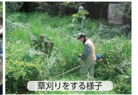
草刈りをする様子

区では、ボランティアと連携して区内の山々を気軽に楽しんでもらうための活動を行っています。今回は、一緒に活動するボランティア団体を紹介します。