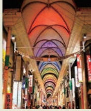
アカウント名 soranekonya ◀フォトコンテスト入賞作品

電話はできるだけ各課直ダイヤルのご利用を。市役所と各区役所の代表電話は、☎082-245-2111(共通)