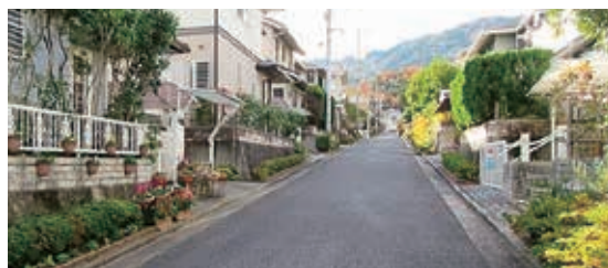
←建築協定の失効をきっかけに平成24年に地区計画を定めた、佐伯区彩が丘地区。緑豊かでゆとりのある街並みが維持されています。

市は、制度を詳しく知りたい団体への出前講座や、ルール作りのアドバイスなど、皆さんが安心して地区計画を作れるようにお手伝いをします。気軽に都市計画課までお問い合わせください。