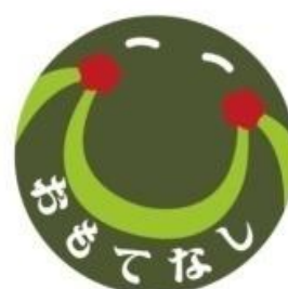
広島市東区もてなしの シンボルマーク