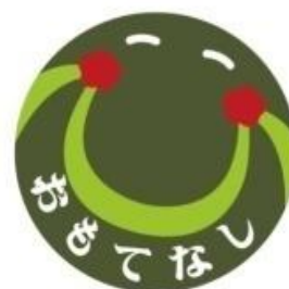
広島市東区もてなしの シンボルマーク