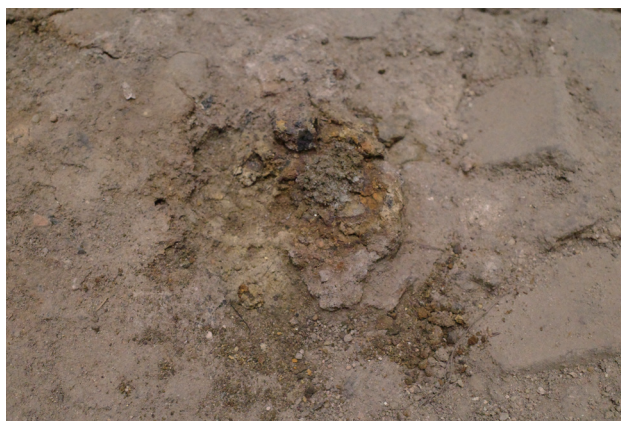
2023/9/14 析出物除去後の様子。