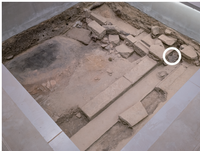
R5/6/15 丸印の部分の崩壊を確認した。

5月、7月に確認した北側屋敷境石材列下層部分の崩壊は、令和5（2023）9月の清掃後から変化は見られない。※詳細は定点カメラデータ（2312teiten）を参照