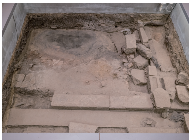
2023年11月17日撮影 (東側から撮影)