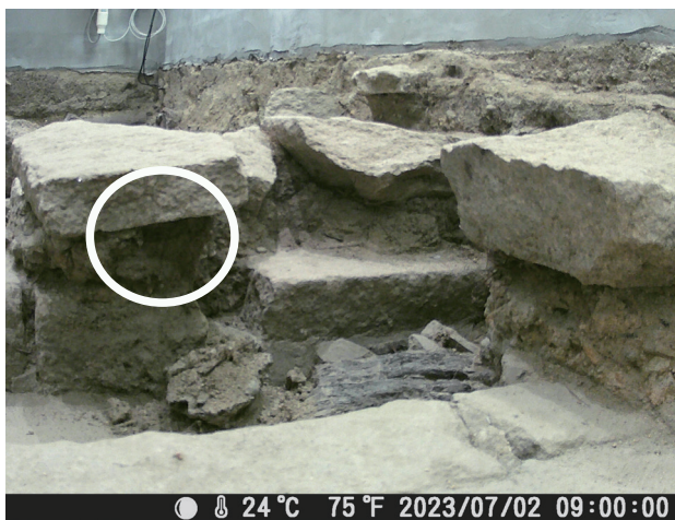
7/2 定点カメラ画像 石列下層部の土層部分の崩壊が進んでいる。