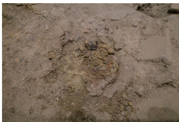
2023/12/15 析出物除去後から大きな変化は見られ ない。