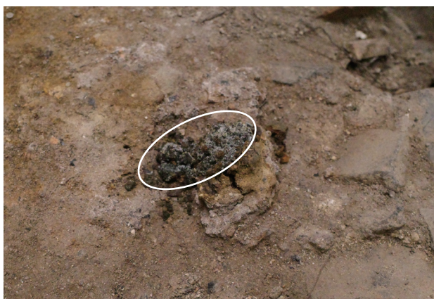
2023/5/16 丸印の部分で、塩が析出か。表層の割れと ともに下層部分が表出。