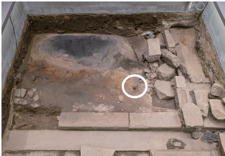
2023/5/16 丸印の部分が、析出 している場所。