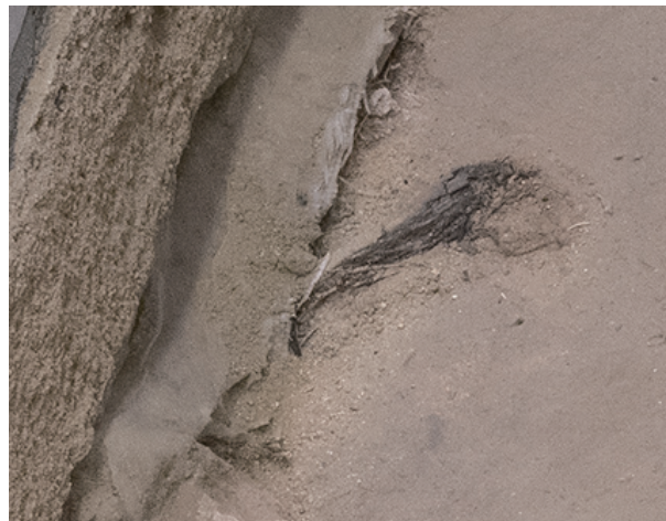
2023/9/14 炭化材周辺の土を除去。