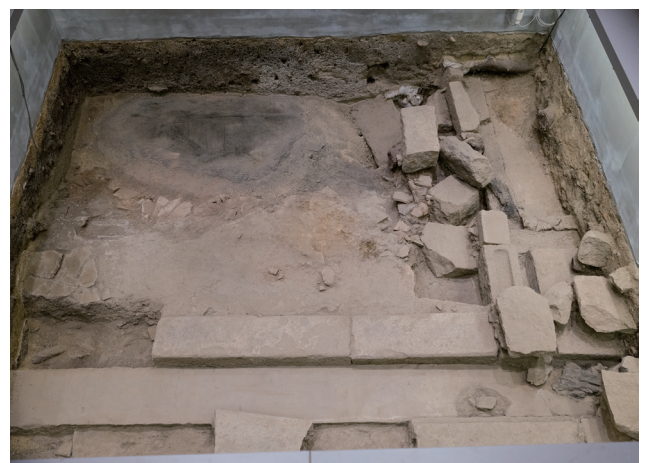
2023年12月15日撮影 (北側から撮影)