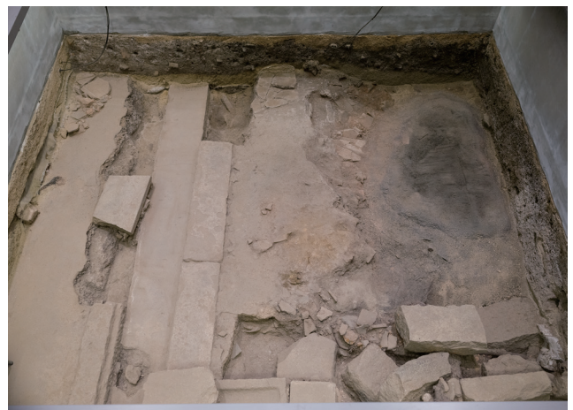
2023年12月15日撮影 (北側から撮影)