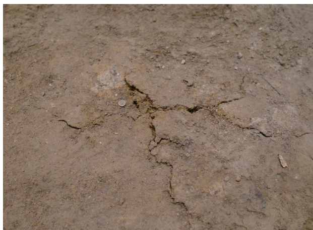
2023/11/17 亀裂 縦約 10.6cm 横約 16.5cm