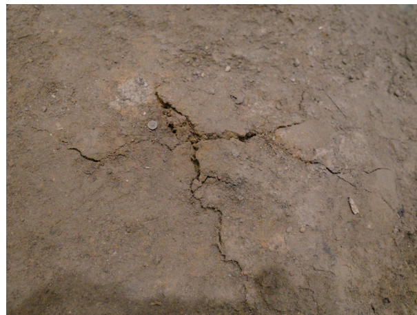
2023/12/15 亀裂 縦約 10.9cm 横約 17.7cm