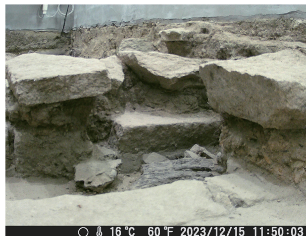
12/15 定点カメラ画像 崩壊後から変化は見られない。