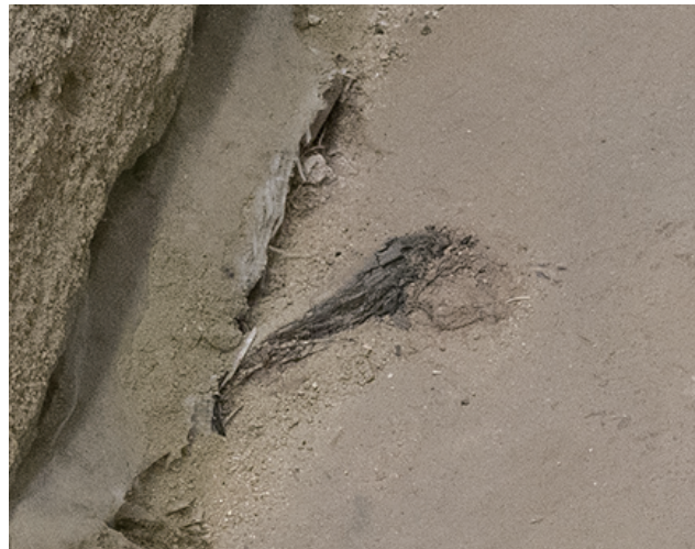
2023/12/15 前月から変化はない。