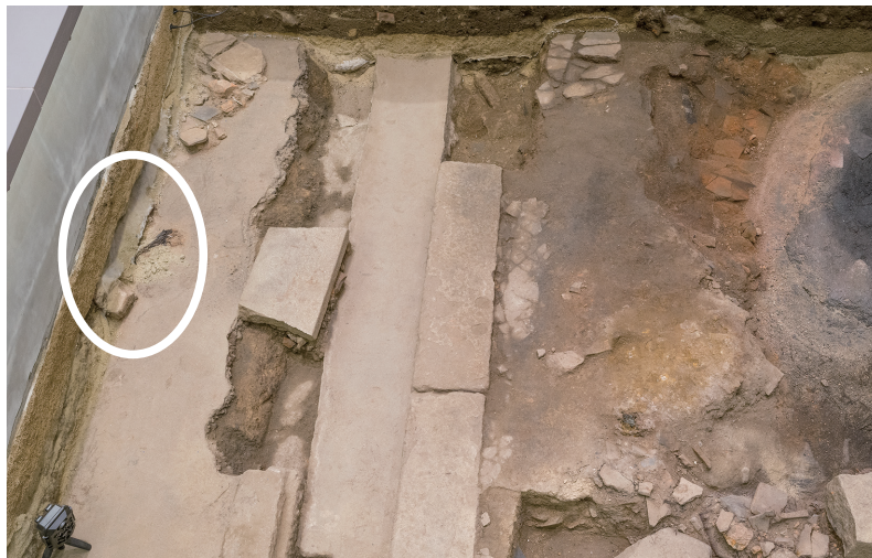
2022/5/16 丸印の部分が崩壊。

①令和4（2022）年5月に一部崩落が確認された東側の壁面は、その後大きな変化はみられない。