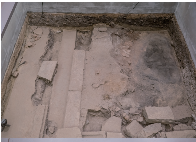
2023年11月17日撮影 (北側から撮影)