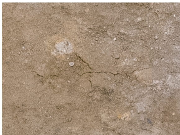
2022/10/13 亀裂 縦約 4.5cm 横約 8.3cm