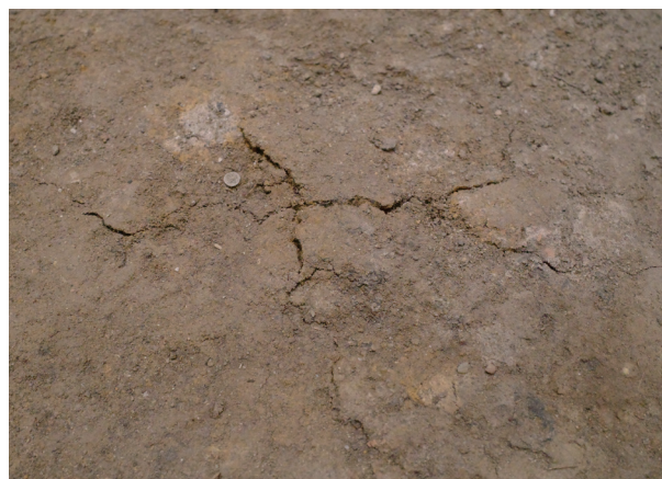
2023/4/24 亀裂 縦約 5.4cm 横約 12.6cm