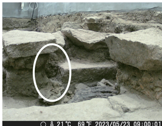
5/23 定点カメラ画像 石列下層部の土層部分が崩壊している。