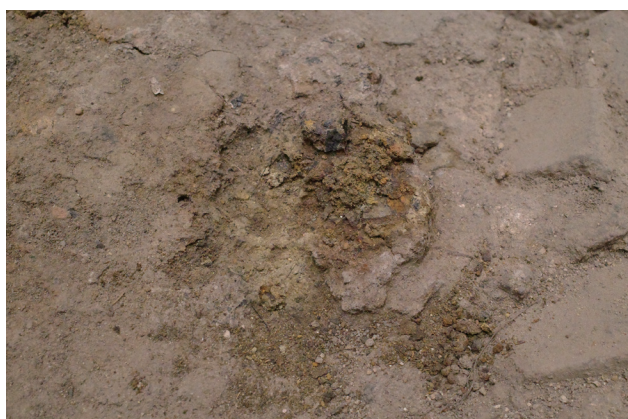
10/13 前月から変化は見られない。