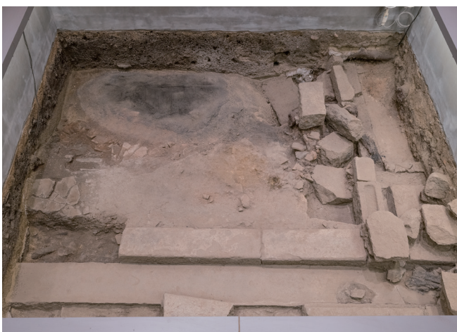
9月14日撮影 (東側から撮影)