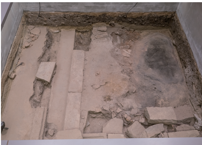
9月14日撮影 (北側から撮影)