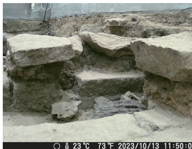
10/13 定点カメラ画像 崩壊後から変化は見られない。