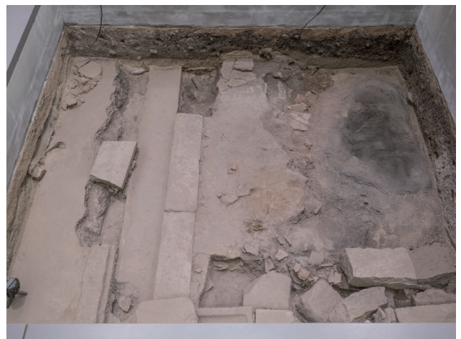
10月13日撮影 (北側から撮影)