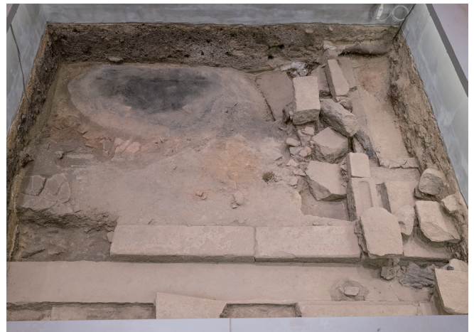
6月15日撮影 (東側から撮影)