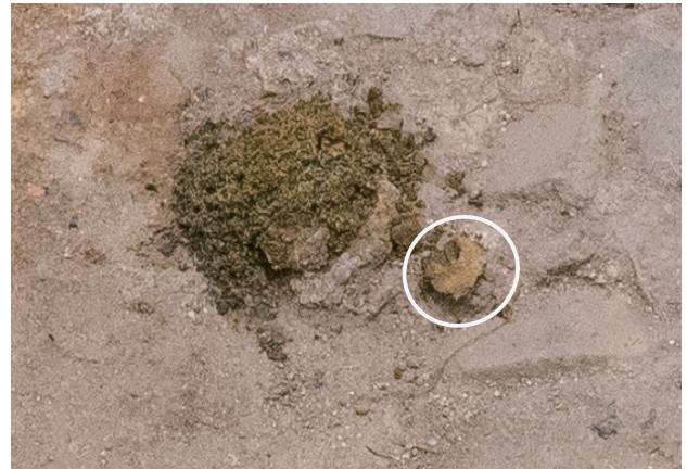
10/13 表面全体が茶色く変化している。表出した部分※が周囲に崩れ落ちていることがわかる。 ※白丸の部分