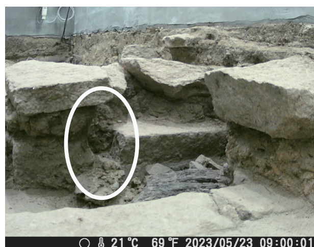
5/23 定点カメラ画像 石列下層部の土層部分が崩壊している。