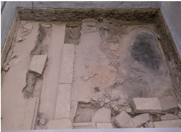
5月16日撮影 (北側から撮影)