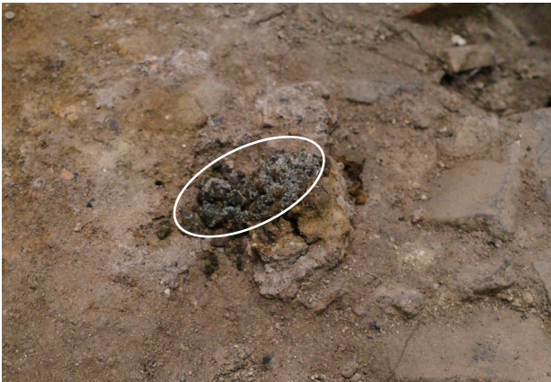
5/16 丸印の部分で、塩が析出か。表層の割れとともに下層部分が表出。