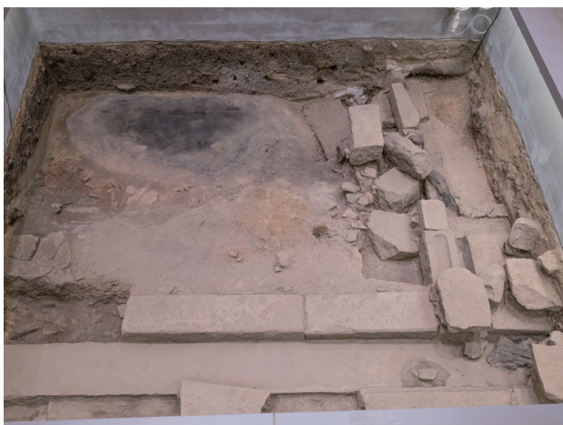
5月16日撮影 (東側から撮影)