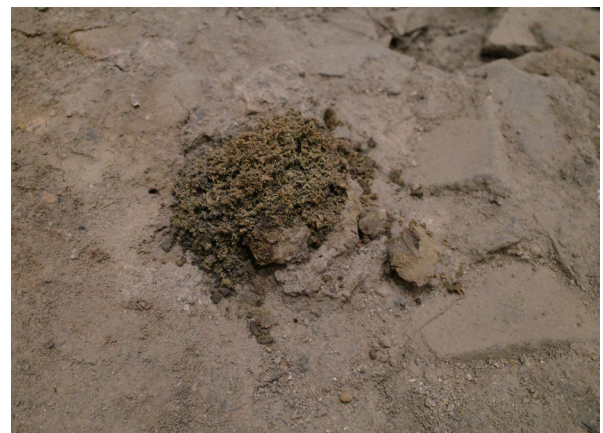
6/15 前月から大きな変化はないと思われる。