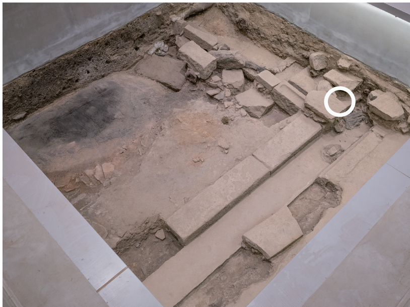
R5/6/15 丸印の部分の崩壊を確認した。