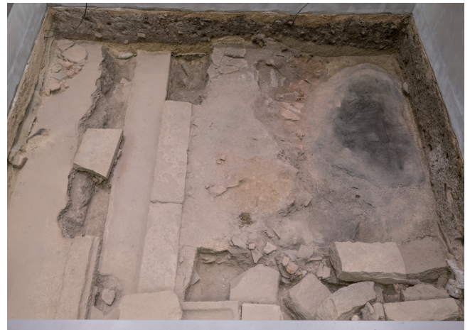
6月15日撮影 (北側から撮影)