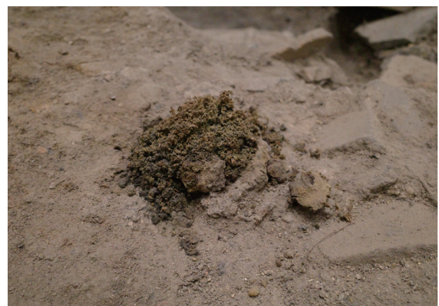
5/16 前月から大きな変化はないと思われる。