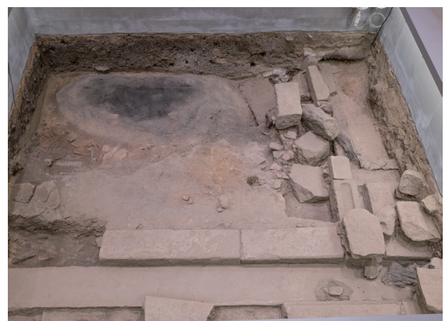
5月16日撮影 (東側から撮影)