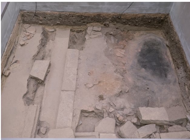
3月13日撮影 (北側から撮影)