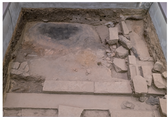
4月24日撮影 (東側から撮影)