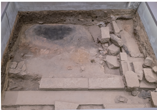
3月13日撮影 (東側から撮影)