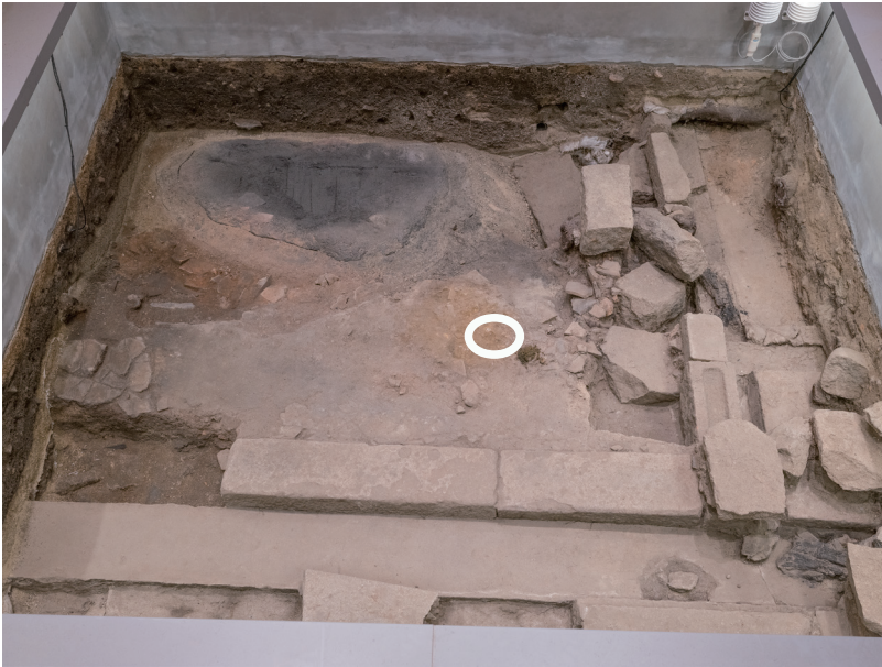
R4/10/13 丸印の部分に亀裂が入っている。

玄関土間と畳状炭化材の間にある遺構面で、令和4年10月から表層に亀裂を確認している。 前月から大きな変化は見られない。