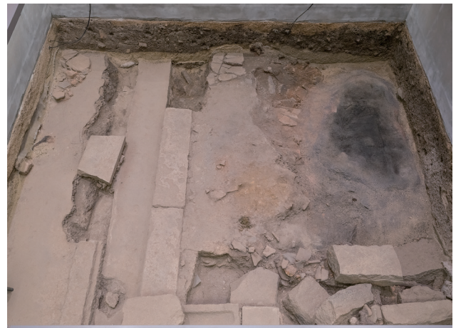
4月24日撮影 (北側から撮影)