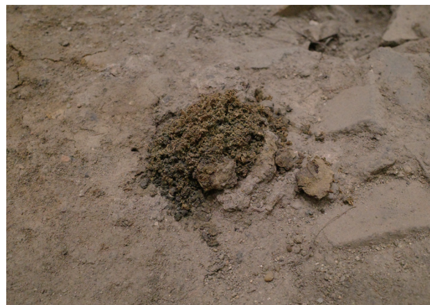
4/24 前月から大きな変化はないと思われる。