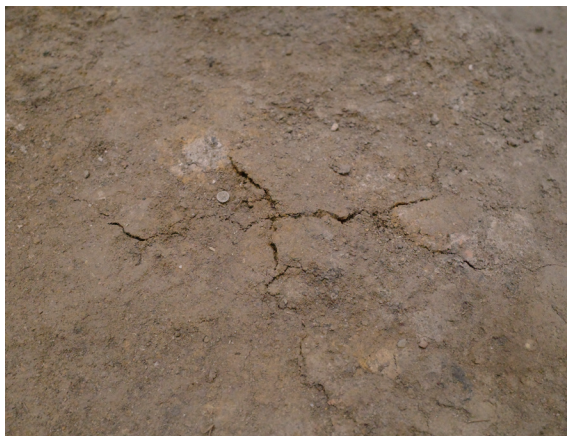
4/24 前月から大きな変化は見られない