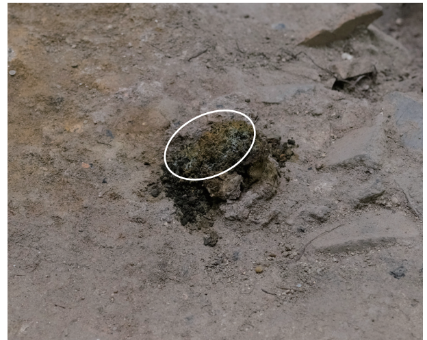
8/24 表面の白かった部分が、茶色に変色したように見える。