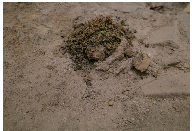
3/13 10月から大きな変化はないと思われる。