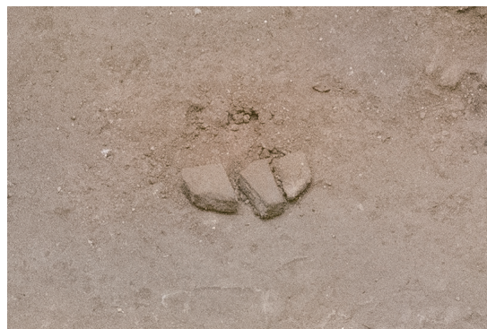
2/15 左側の石材二つの位置が 4.6cm 程度ずれている。