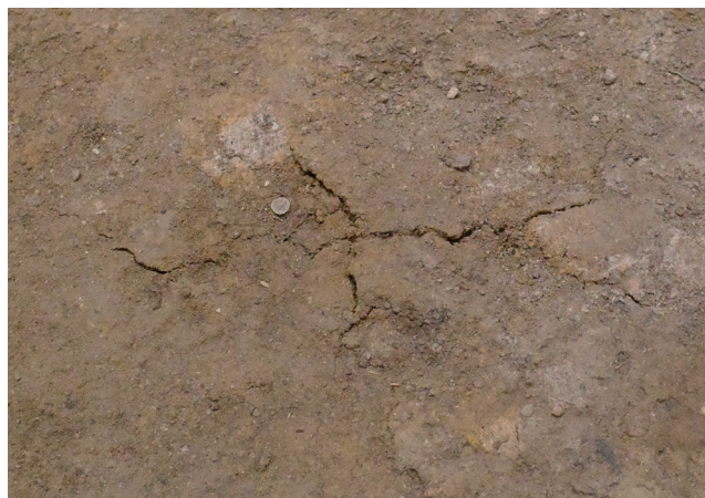
2/15 亀裂の範囲 東西方向：9.3 cm程度 南北方向：4.8 cm程度