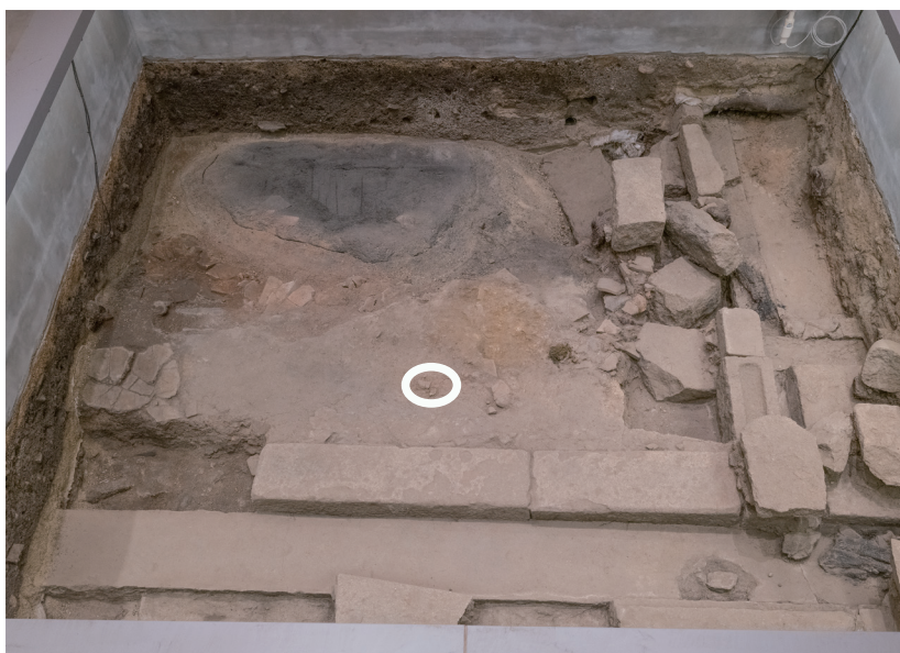
12/14 丸印の部分に亀裂が入っている。

玄関土間と畳状炭化材の間にある遺構面で、10月から表層に亀裂を確認している。前月から大きな変化は見られない。