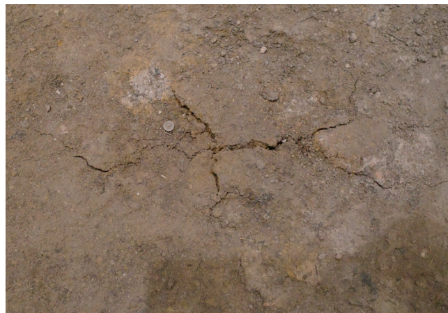
2/15 亀裂の範囲 東西方向：9.5 cm程度 南北方向：4.8 cm程度