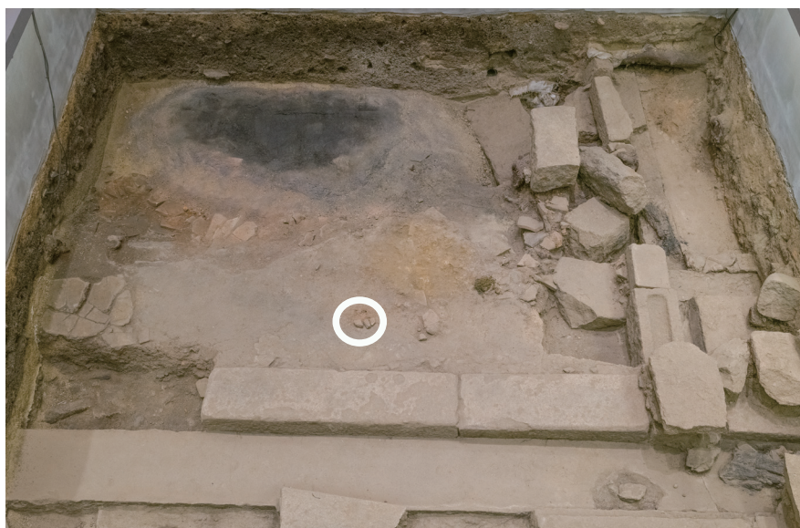
2/15 丸印の部分で崩壊が見られた。

ずれた石材を原状回復しても差し支えないと判断し、平和推進課職員了承のもと、元の位置に瓦を戻す作業を行った。