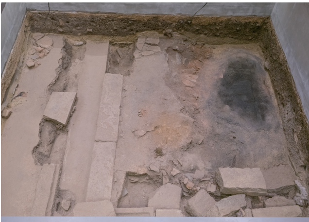
2月15日撮影 (北側から撮影)