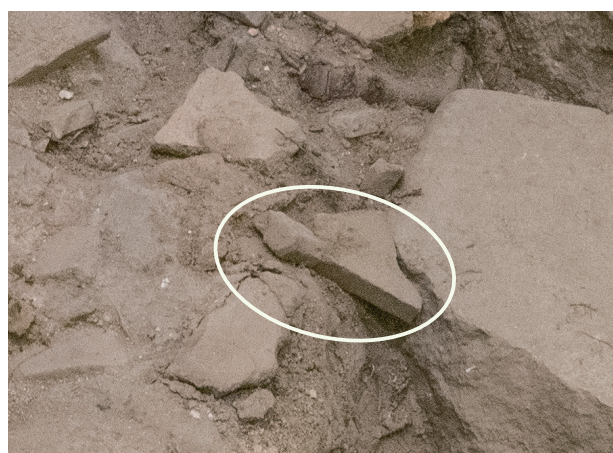
12/14 瓦がずれてしまっている。