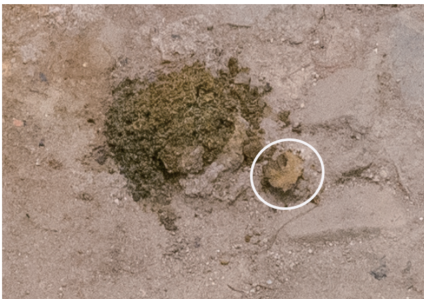
10/13 表面全体が茶色く変化している。 表出した部分※が周囲に崩れ落ちていることがわかる。 ※白丸の部分