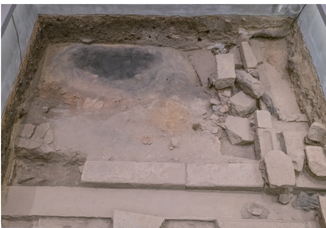
2月15日撮影 (東側から撮影)