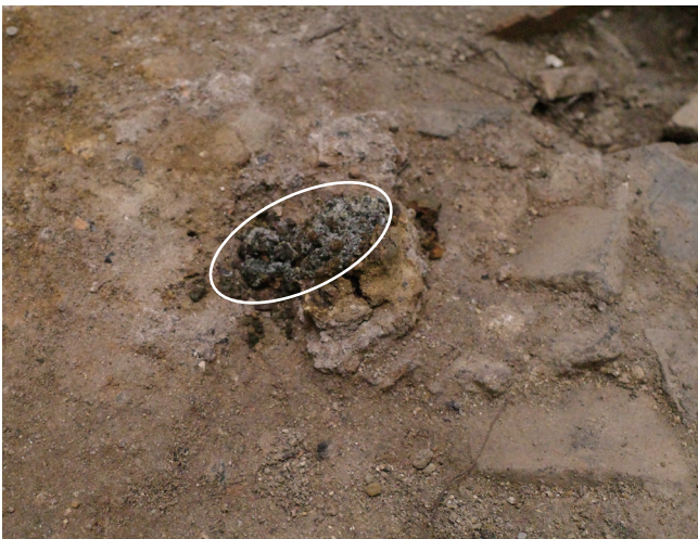
5/16 丸印の部分で、塩が析出か。表層の割れとともに下層部分が表出。