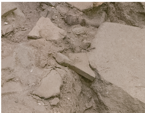
2/15 先月から大きな変化は見られない。