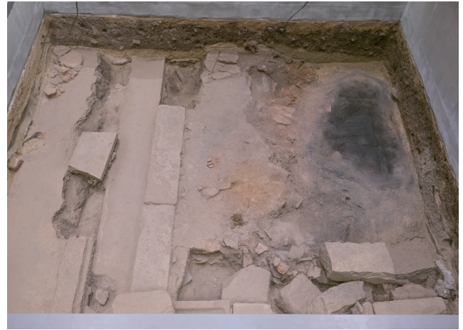
2月15日撮影 (北側から撮影)