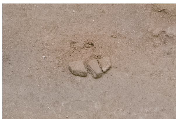
2/15 左側の石材二つの位置が 4.6cm 程度ずれている。