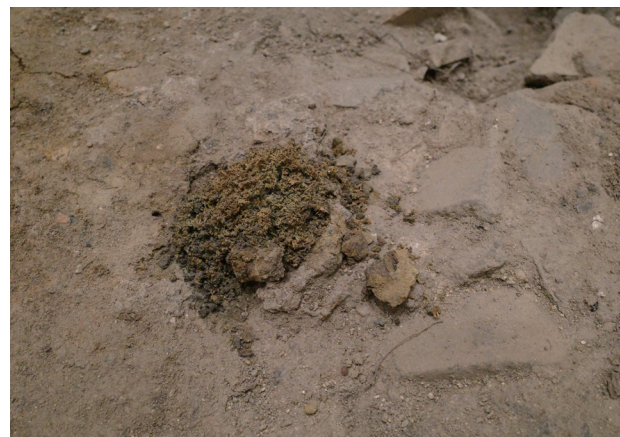
2/15 10月から大きな変化はないと思われる。