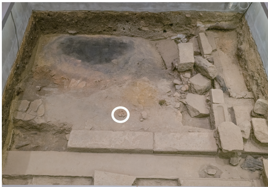
2/15 丸印の部分で崩壊が見られた。