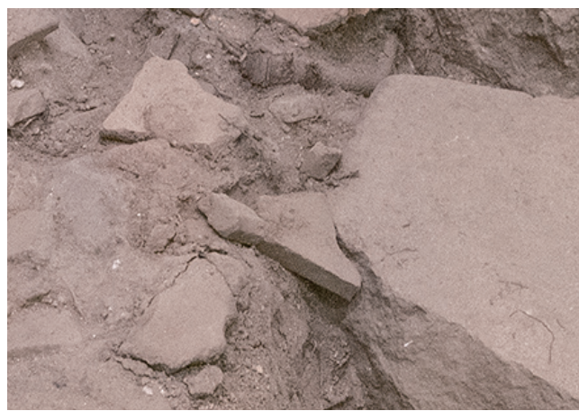
1/11 先月から大きな変化は見られない。