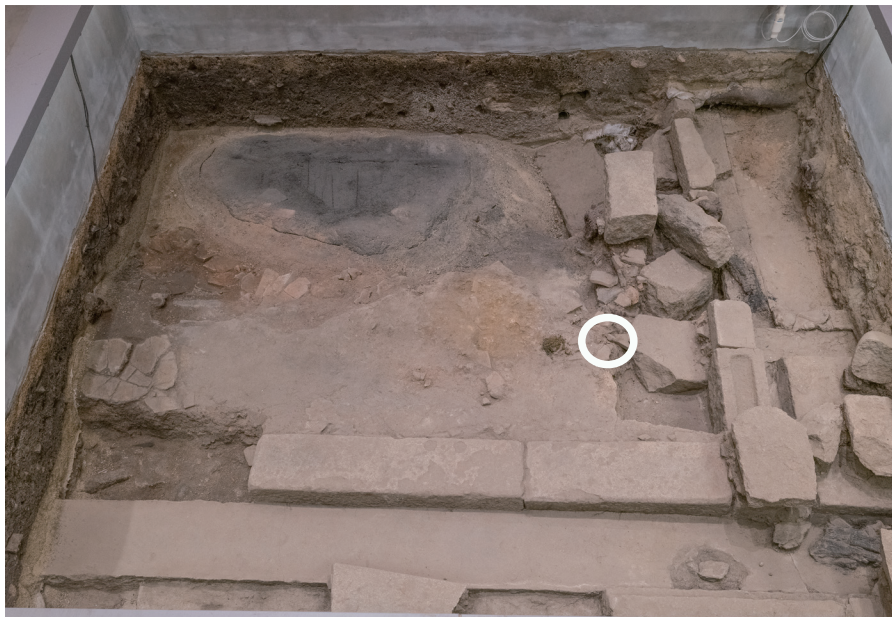
12/14 丸印の部分で崩壊が見られた。

北側屋敷境石材列付近の遺構表層にあった瓦の位置がずれていることを12月に確認した。 その後、崩壊場所周囲に変化は見られない。