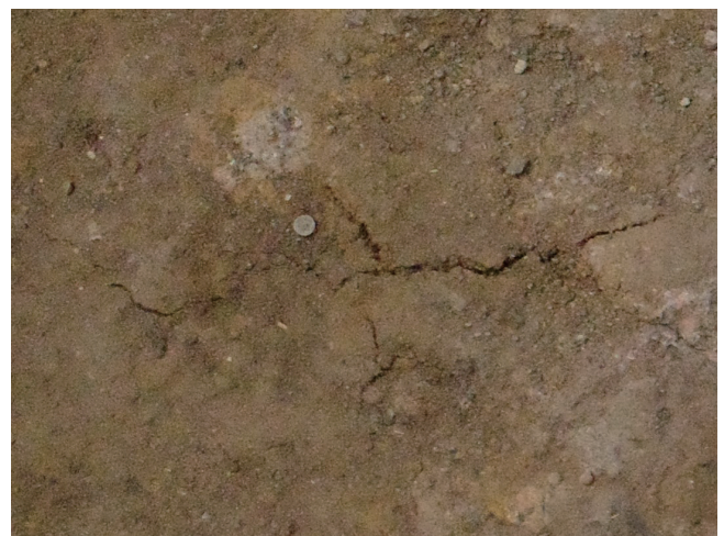
1/11 亀裂の範囲 東西方向：9.1 cm程度 南北方向：4.8 cm程度