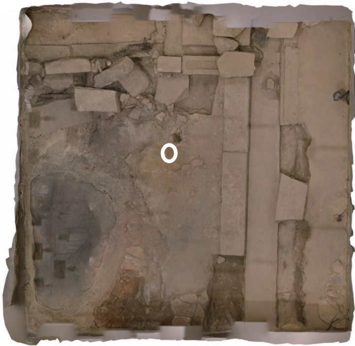
12/14 丸印の部分に亀裂が入っている。

玄関土間と畳状炭化材の間にある遺構面で、10月から表層に亀裂を確認している。月日を経るごとに亀裂が少しずつ広がっている。