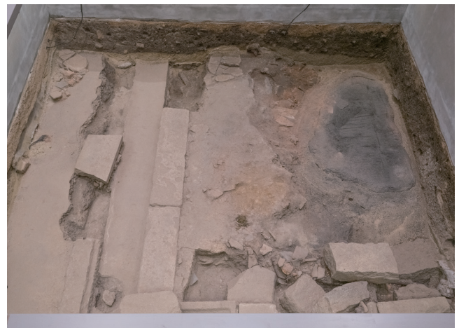
1月11日撮影 (北側から撮影)