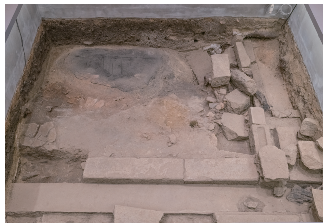
1月11日撮影 (東側から撮影)