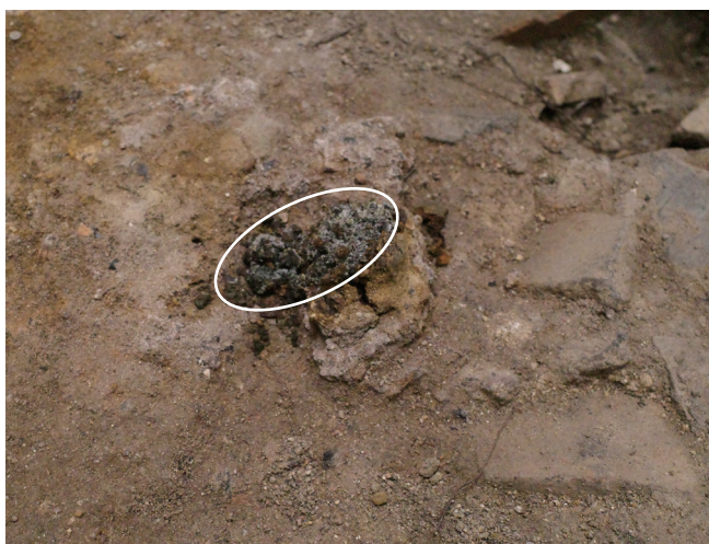
5/16 丸印の部分で、塩が析出か。表層の割れとともに下層部分が表出。