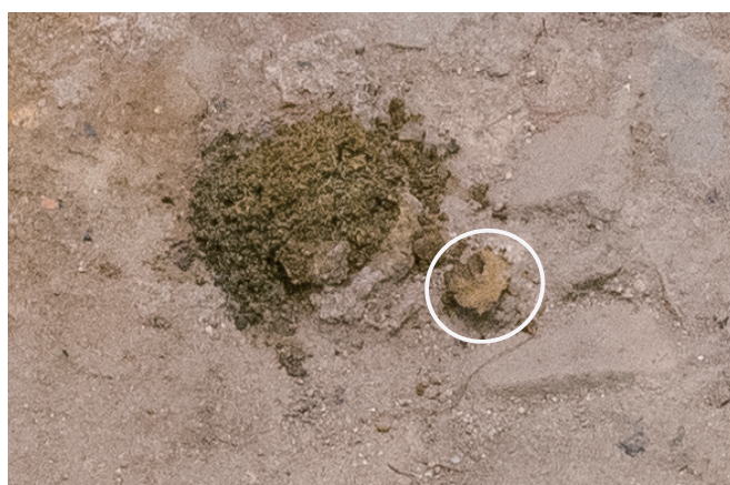
10/13 表面全体が茶色く変化している。 表出した部分※が周囲に崩れ落ちていることがわかる。 ※白丸の部分