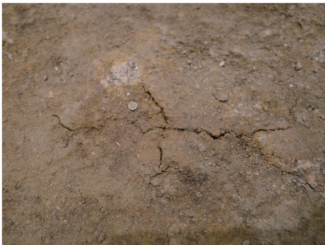
12/14 亀裂の範囲 東西方向：8.7 cm程度 南北方向：4.7 cm程度