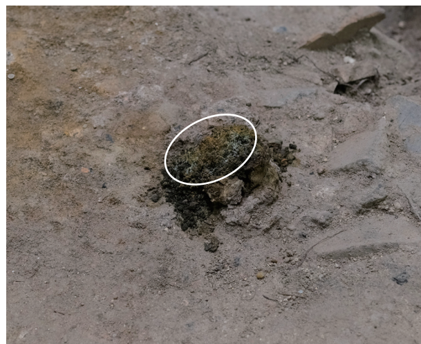
8/24 表面の白かった部分が、茶色に変色したように見える。