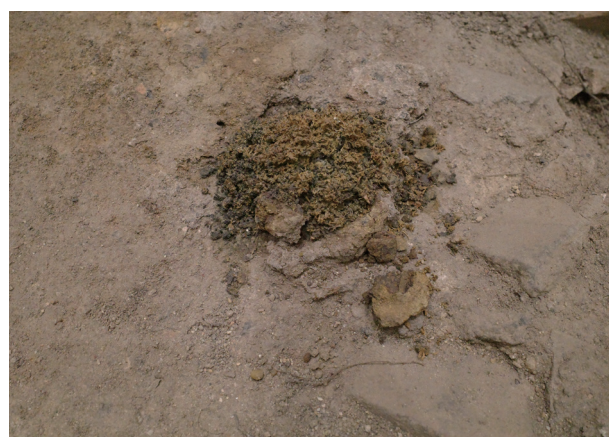
1/11 10月から大きな変化はないと思われる。