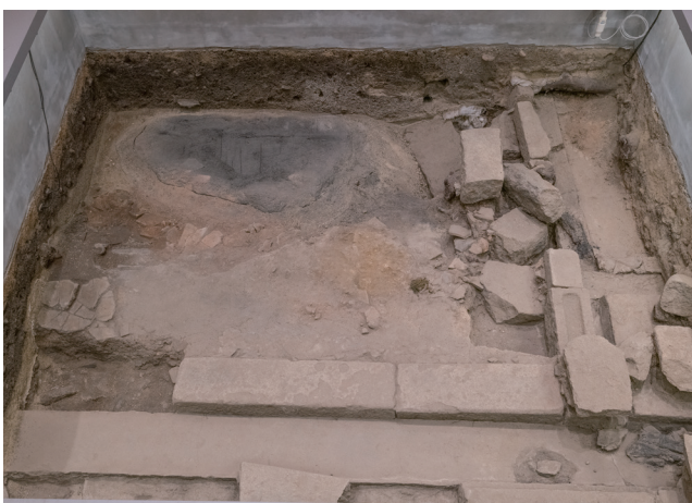
12月14日撮影 (東側から撮影)