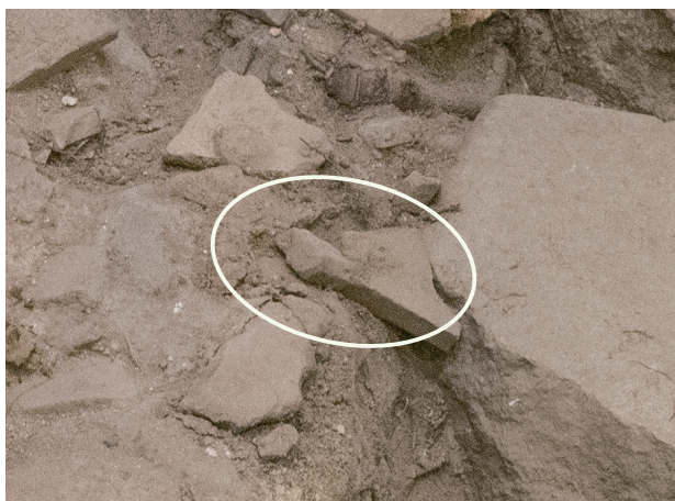
12/14 瓦がずれてしまっている。