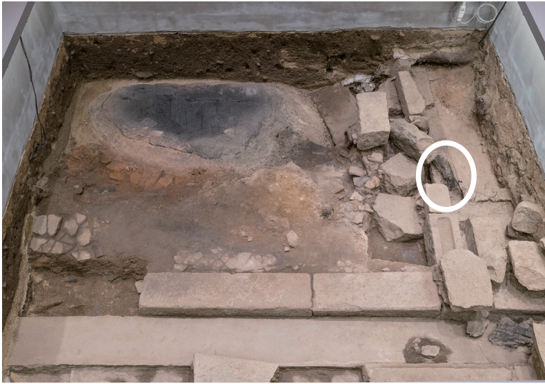
5/16 丸印の部分が崩壊。

②北側石材列にある炭化材については、7月のモニタリング時から変化はないと思われる。