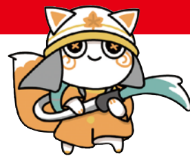
広島市消防局マスコットキャラクター「もみみん」