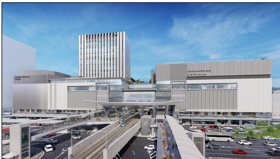
広島駅南口広場全景