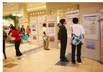
オープンハウス型説明会のイメージ

この取組を市民の皆さんに広く知っていただくとともに、平和大通りの魅力や価値を高めるアイデアについて、幅広くご意見をお聞かせいただきたいと考えていますので、ご都合の良い時間にお気軽にお越しください！