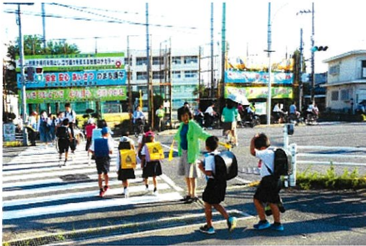
交通安全街頭キャンペーン（庚午地区）

災害への備えを十分に行うとともに、犯罪や事故の起こりにくい、安全・安心に暮らせるまちづくりを進めます。また、環境や景観に配慮した美しいまちづくりを進めます。