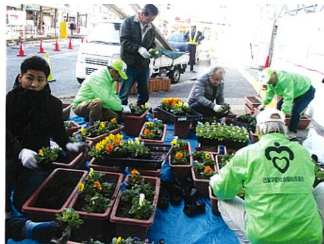
花を活用した「もてなしの場づくり」