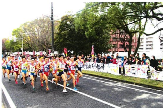
西区RUNRUN応援ひろば（西区役所前緑地）

子どもから高齢者、外国人などの様々な人や、物・情報が行き交うにぎわいのある活動的なまちづくりを進めます。