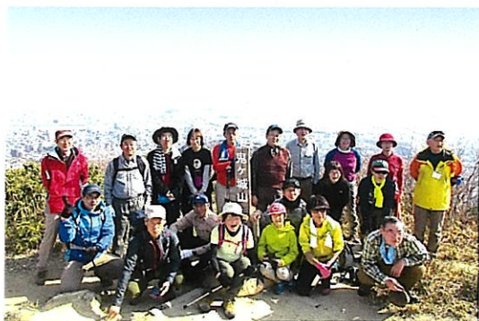
西区やまなみハイキングルート（鬼ヶ城山）

太田川放水路や天満川、宗箇山（三滝山）や鈴ヶ峰などの豊かな自然や、西国街道、三瀧寺などの歴史的・文化的資源を生かしたまちづくりを進めます。