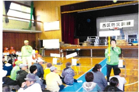
防災訓練（井口地区）