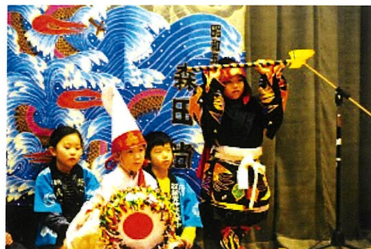
子ども神楽体験教室（古田公民館）