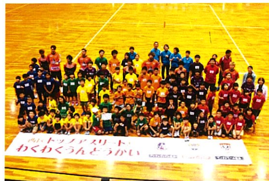
西区トップアスリートとわくわくうんどうかい