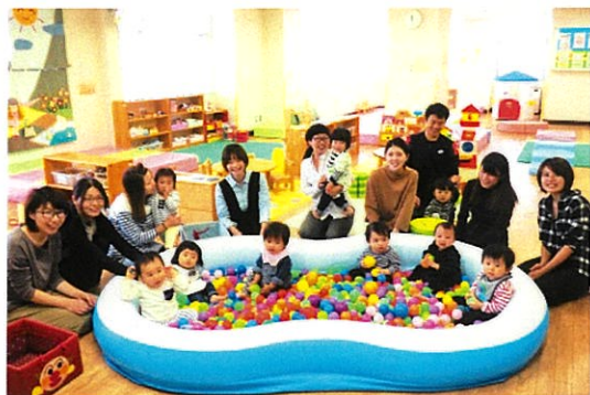
にしくニコニコひろば

人と人のつながりを通して次世代の人材を育てるとともに、みんなで助け合い、支え合う健康で元気なまちづくりを進めます。