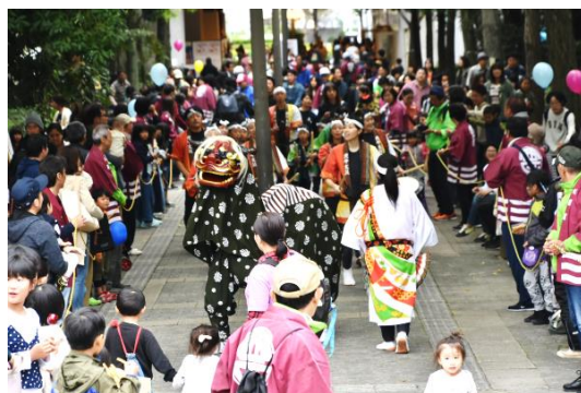
西区民まつり（パレード）