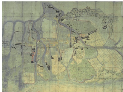
享保13年(1728年)広島町新開絵図

広島城下でも、太田川河口のデルタが次々と干拓されていきました。享保20年(1735年)までに検地を受けた城下周辺の主な新開地は、右の表のとおりですが、海面地先の新開は幕領に編入するという、ときの幕府の方針もあって、この方針が18世紀末に事実上撤回されるまで、新開造成は中断されました。19世紀に入ると水主町御普請開・江波丸子新開・観音沖新開などが築かれましたが、町人や農民自身の手による民営の新開が主流となりました。