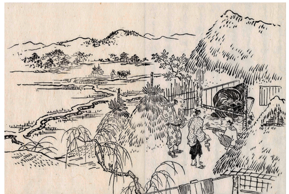
農村の風景(『芸備孝義伝 三編巻十三』より)

村の住人は農民を中核とする百姓身分とされましたが、村によっては被差別身分とされた「かわた」が配置され、また神官・僧侶や医師、あるいは漁師たちも村の構成員でした。農民の存在形態も様々で、ある程度の石高と屋敷地を持つ本百姓とよばれた人々だけではなく、小地片の耕地しか所持していない農民や全く土地を持たない人々もいました。こうした土地を持たない人々を18世紀に入る頃に「浮過」と呼ぶようになりました。これは「無地浮世過」の略称であり、小作や雑業で生計をたてていた人々です。しかし浮過という身分呼称はあいまいで、裕福な問屋商人が浮過とされたり、漁師が百姓なのか浮過かは、村によってばらばらでした。しかしながら、近世後期になると、商品生産の発展につれて、本百姓の階層分化が進み、本百姓が上昇したり、没落したりして村の社会構成は大きく変動していきました。