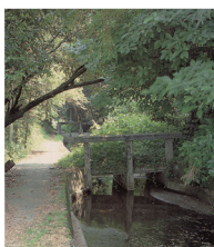
八木用水取水口

工事は、明和5年4月4日に開始され、村人の協力と昼夜兼行作業により28日に完成しました。