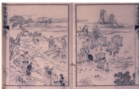
定用水開削の図[広島市立中央図書館蔵] [『芸備孝義伝 拾遺上』より]

工事は、明和5年4月4日に開始され、村人の協力と昼夜兼行作業により28日に完成しました。