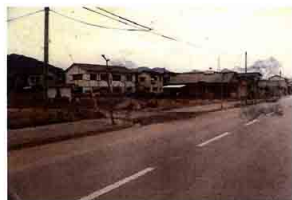
▲中央二丁目付近（昭和45年）