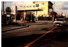
▲中央二丁目付近（昭和56年）