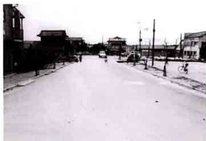
▲昭和41年頃の産業道路南側