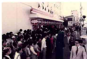
▲イズミ五日市店のオープン（昭和52年）