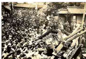
▲五日市の喧嘩みこし（昭和16年）