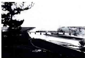
▲八幡川河口鉄道開通（明治30年）