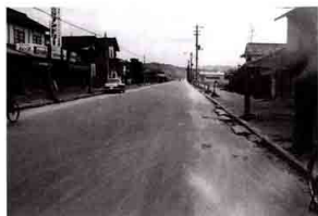
▲昭和41年頃の産業道路北側