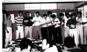
▲中央通り商店街青年部発会式 1977（昭和52）年