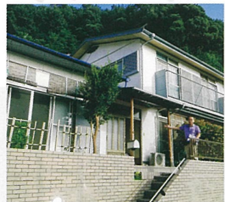
① 東区牛田南町 うしたあらぐさクラブ

子どもたちに多様な教育の機会を提供するために学習支援を軸に子ども支援を行います。