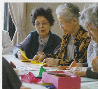
⑥ 西区己斐本町 わくわくクラブ

認知症予防カフェによる高齢者の健康・居場所づくりや、子ども一時預かり等の居場所づくりを進めます。