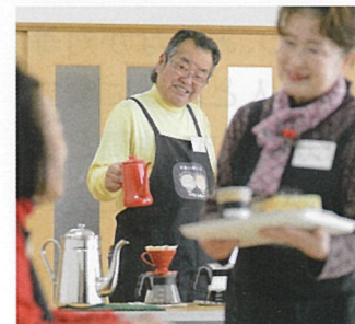
⑭ 安佐南区伴東 すまいるワーク

地域住民の皆様がこの地域に安心して住み続けられるよう交流の場づくり(カフェサロン)等を進めます。