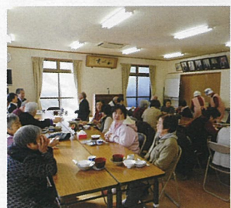
⑤ 西区三篠北町 みんなのわいわい広場

地域の高齢者がみんなでわいわい集える食事提供やサロン(居場所づくり)を行います。