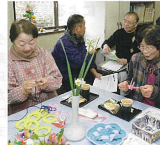
⑫ 安佐南区伴東 GO郷・まつむね

地域の環境は自らの手で守るを合言葉に、里山整備や高齢者等の居場所づくり等を進めます。