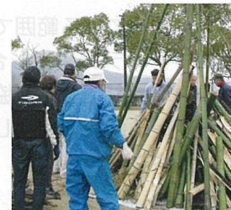
⑮ 安佐南区毘沙門台 びしゃもん台 絆くらぶ

町内会、学区社協、びしゃもん台絆くらぶがそれぞれ役割分担して、地域住民に高品質なサービスを提供します。