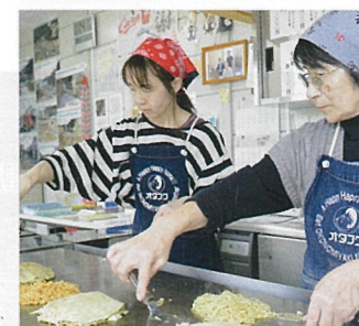
⑯ 安佐南区八木 復興交流館 モンドラゴン