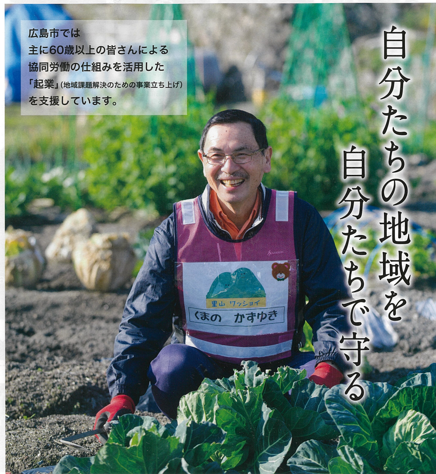
広島市「協同労働」プラットフォーム(らぼーろひろしま)