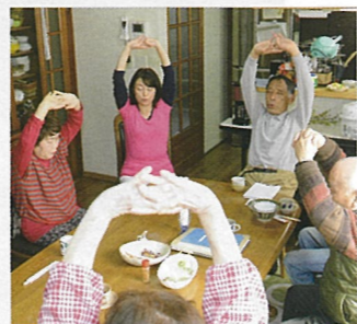
⑱ 安佐北区亀崎 タンポポのわたげ

地域住民の皆さんのコミュニティ再生を目標に、住民の方のご自宅の一角をお借りしたおうちサロンを進めます。