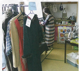
⑧ 安佐南区上安 夢咲庵

地域の居場所としての常時開設のサロン、住民の手作り作品の展示販売やおりづる製作もを行います。