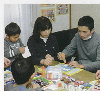
⑲ 安佐北区白木町井原 ひねもすようこそ

障がい者や高齢者が地域でいつまでも安心して生活ができるような交流の場づくりや困りごと支援を進めます。