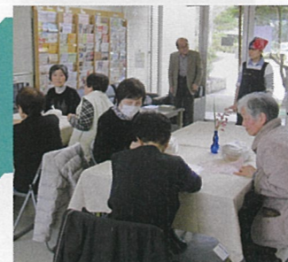
⑬ 佐伯区河内南 サロンド・ワーク彩

高齢者等誰もが気軽に集えるカフェサロンを中心に、団地の賑わい作りを目指して事業を進めます。