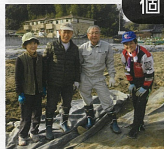
⑦ 東区福田 真正面

耕作放棄地の活用による野菜作りや、農業体験・収穫祭等での地域住民との交流の場づくりを目指します。