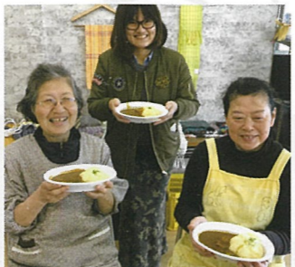
③ 南区似島 サンセットビューにのしま

地域住民の方が気軽に立ち寄れるサロンや、島に訪れる人との交流を進める機会作りを行います。