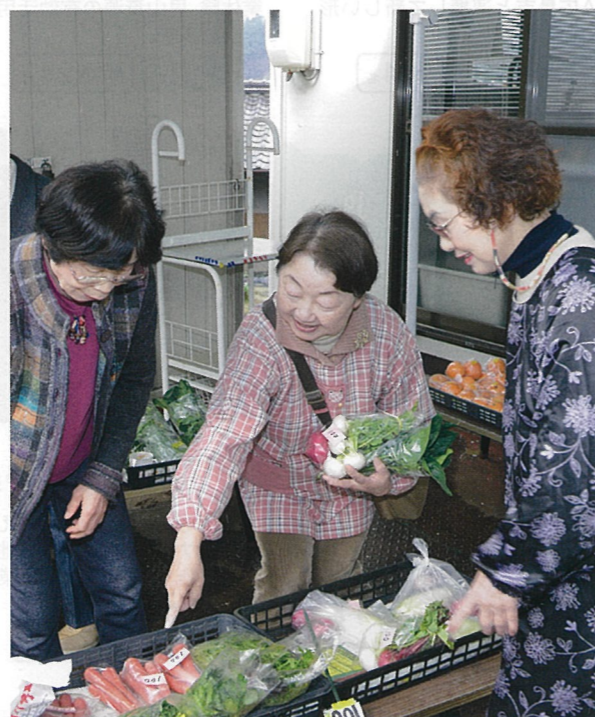
【GO郷・まつむね】ご近所の方が作った農作物等を販売する「GO郷市場」。