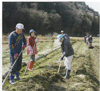
② 安佐北区白木町秋山 河津川プロジェクト

耕作放棄地を利用した農業や高齢者の藁細工技術を継承して宝船等藁細工の製造販売をします。