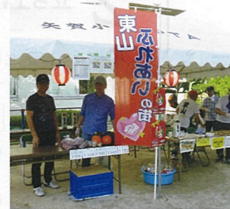
⑪ 東区東山 元気で楽しい 東山をつくらう会

町内会加入率が下がる中、マンションを中心にした全住民のコミュニティの再生を目指します。