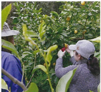
④ 南区似島 シトラスガーデンにのしま