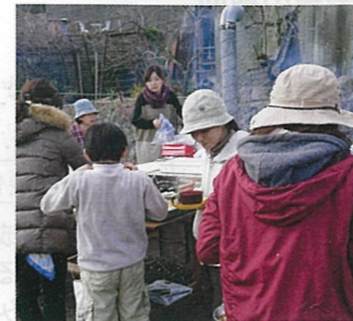
⑩ 安芸区畑賀 協同労働 「里山ワッシュヨイ」

休耕田を活用した景観向上や地域住民の交流の場づくり、農業体験、里山資源の有効活用等を進めます。