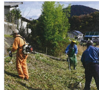
⑨ 安佐南区伴 アグリアシストとも

耕作放棄地や休耕田を整備し農と共にある景観を守るためJA広島市と連携して新しい形の農業を進めます。