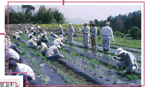
ふれあい農業教室