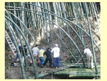
大塚かぐや姫プロジェクト