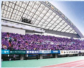
広島ビッグアーチ