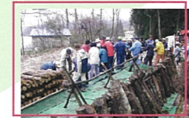
森いきいき戸山林業体験教室