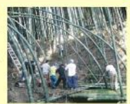
大塚かぐや姫プロジェクト