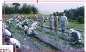
ふれあい農業教室