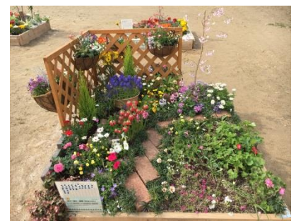
【レイアウト等すべて一から考えて制作】

4月17日まで、中央公園で開催される春のグリーンフェアの「市民ふれあいミニガーデン」に沼田支部で出展しました。ぜひ見てください！