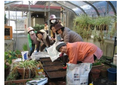
【支部のみんなで種蒔き】

3月の中旬頃、沼田支部でお借りしている伴東小学校の温室で、マリーゴールドの種を蒔きました。マリー