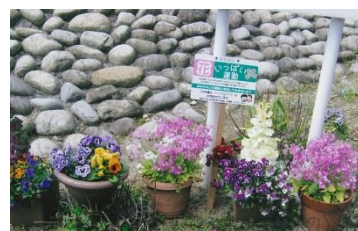
【団地内を花いっぱい！！】

団地内の斜面や空いたスペースにアジサイを植えようと、昨年からアジサイの挿し芽をしています。暖かくなるにつれ、根も伸びてきているようだったので、成長を促すために畑に移植しました。今年はまだ花を見ることはできないと思いますが、見守って育てていきたいと思っています。