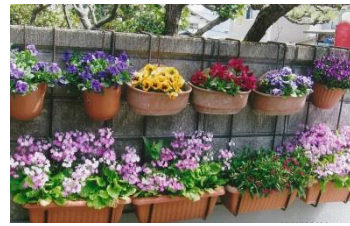
【自宅を飾るたくさんの花】

4月に入り、寒かった冬が終わって暖かくなりました。あちらこちらで、水仙や桜草、愛らしいムスカリの