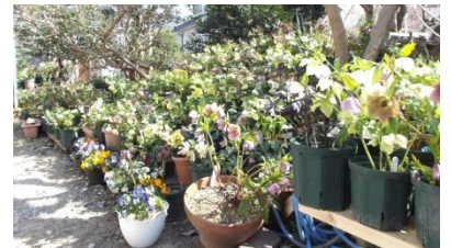
【見事なオープンガーデン】

種類が非常に多く、咲き方や花卉の形、模様など様々です。特に交配種は世界に2つと同じものがないほどです。