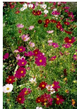
【鮮やかなコスモス】

入口には立派に育った貴船草をはじめ、いろいろな花が植えてあり、中央にはちょうど見ごろのコスモスが一面に咲いていました。奥に行くとダリア、のこん菊、柿の木、イチジク、メルヘンの小屋（この中にはテーブルやいすが置いてあり、壁には絵や写真が飾ってありました。）池、そして今は緑ばかりですが斜面に山つつじ、桜が植えてあり、春には今と違った趣の庭を楽しめそうでした。飲み物も置いてあり、風も心地よく、心からゆっくりさせていた