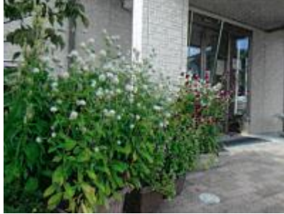
【デイサービスともの入口】

花みずきの木を中心に全体につつじの植え込みだったのが年数とともに一部分を残してつつじ