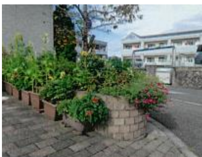
【デイサービスとものU字花壇】

皆さんを楽しみにさせる花壇にしていきたいと思いを込めてパンジー、金魚草の種を蒔きました。順調に育っています。