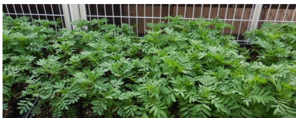
[育苗中のマリーゴールド]

11月6日(日)、安佐南文化センターで開催される安佐南区民まつりに「花いっぱい運動推進委員会」は、今年も花の塔を制作し区民の皆さんに観ていただきます。花の塔に飾る花は、サルビア、マリーゴールド、ペコニア等で、私達推進委員会のスタッフが種から育てます。安東支部は、マリーゴールドを担当することになり、安東公民館ホール南側において、8月中旬に種蒔き、9月中旬にポット上げて現在育苗中です。花苗は、順調に生育しており、区民まつりには、綺麗な花で立派な花の塔を造ることができるでしょう。