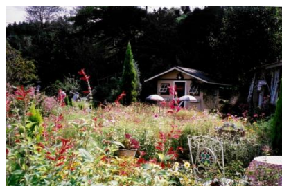
【ダリアがきれいに咲いています】

だきました。ほかの庭は次の機会に行ってみたいと思います。春も公開されますのでぜひ行ってください。安佐南区でもオープンガーデンがみられるといいですね。