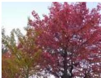
【紅葉をはじめた公園の樹木】

気温の変化とともに区内の公園や街路のモミジバフウ、イチョウなど紅葉期が早い樹木が色付きはじまりました。これから秋の深まりとともに、武田山、権現山、阿武山など区内の山々も紅葉し、綺麗な秋景色になるでしょう。