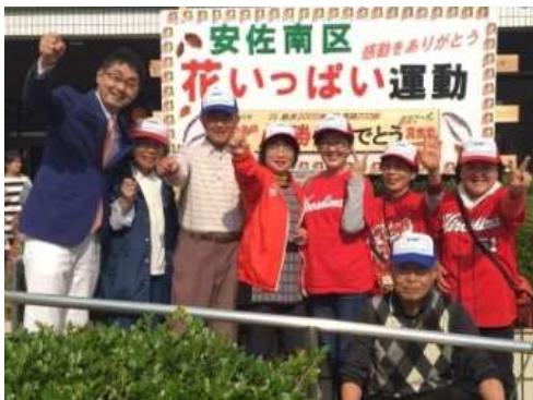
【看板前で記念撮影】

当日、祭り会場には、3万人余の多数の区民の皆さんが来場し、花の塔を観て感動し喜んで頂きました。多くの皆さんが喜ぶ姿を見て、私たちは花の塔を作った達成感と同時にこの運動のやりがいを実感しました。まつり終了後、「花の塔」等に飾っていた花苗約250個を希望者に配布しました。