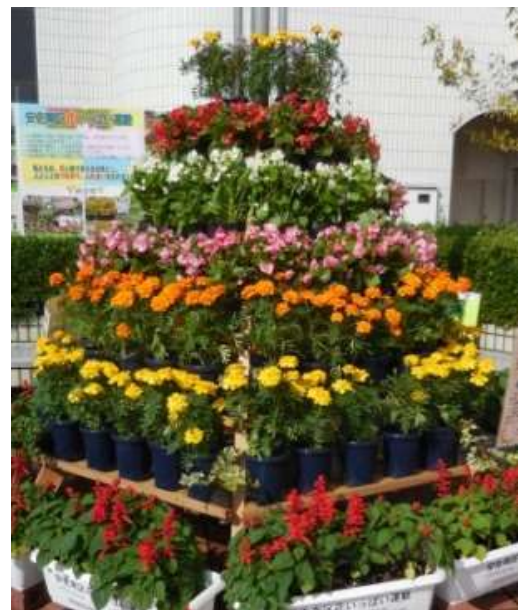
撮影者：上長者辰雄