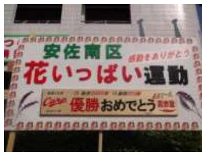
[区民まつりの看板]