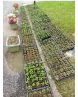
【パンジーを育苗中】

花いっぱい運動沼田支部での種蒔き、鉢上げ、肥料のやり方、病害虫からの防ぎ方等を実践しながら学び、さらに大塚公民館の「花づくり講座」で花の育て方を教わりながら、今秋は安佐南区花いっぱい運動事務局より配布された葉ボタン、ビオラ、パンジー等、花の種約400粒を中心に、現在約1400本の花を育成しています。