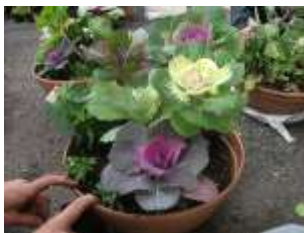
【オンラインワンの寄せ植えです】

33センチの11号鉢にぎっしり植えこまれた寄せ植えは、正月用や卒業制作記念としてオンラインワンの出来栄えに喜んでいただけました。