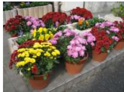
【色鮮やかなスプレー菊】

また、伴東小学校の6年生は6月から菊づくりにも励んでいます。8月の猛暑を乗り越えた菊も、あさみなみ区民まつりの出展時には日照不足でチラホラ咲きでしたが、その後多くの花が咲き揃い、小学校の玄関先や体育館前で学習発表会などに来校される多くの皆さんを楽しませています。