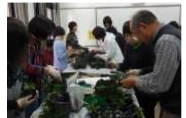
【ハンギングバスケット実習中】

全員がはじめての挑戦であり、失敗を繰り返しながら、先生の丁寧なご指導によりビオラのハンギングバスケットを完成することができました。今は花が少ないですが、今後、花を沢山つけ立派なバスケットになるでしょう。