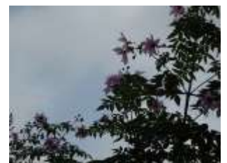
【立派な皇帝ダリア】

11月中旬から安佐南区内の家庭や公園等の皇帝ダリアが咲き始め、11月下旬には区内の各地で満開となり綺麗な花が地上3～4メートルの高さに咲き誇っています。