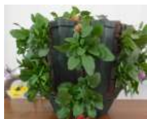
【ビオラのハンギングバスケット】

安東公民館において本年4月から開講された「花づくり講座」の最終回が11月11日開催されました。今回の講座は、ハンギングバスケットへのビオラの寄せ植の実習です。材料は、