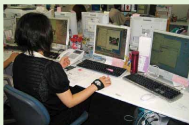
画像処理オペレーター