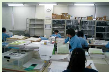
商品発送用ケース作り・検品ほか