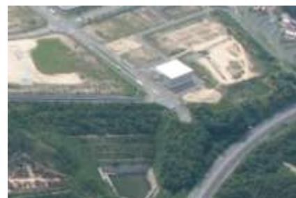
〔整備の中断した幹線道路〕

建設実施計画策定後のバブル経済の崩壊とその後の長期にわたる景気の低迷という社会経済情勢の変化の影響を受け、都市づくりは当初のスケジュールどおり進まなくなったため、平成20年に建設実施計画を推進プランへ改定し、一部開発地区の土地利用計画の変更や目標人口の下方修正などの限定的な見直しを行った。