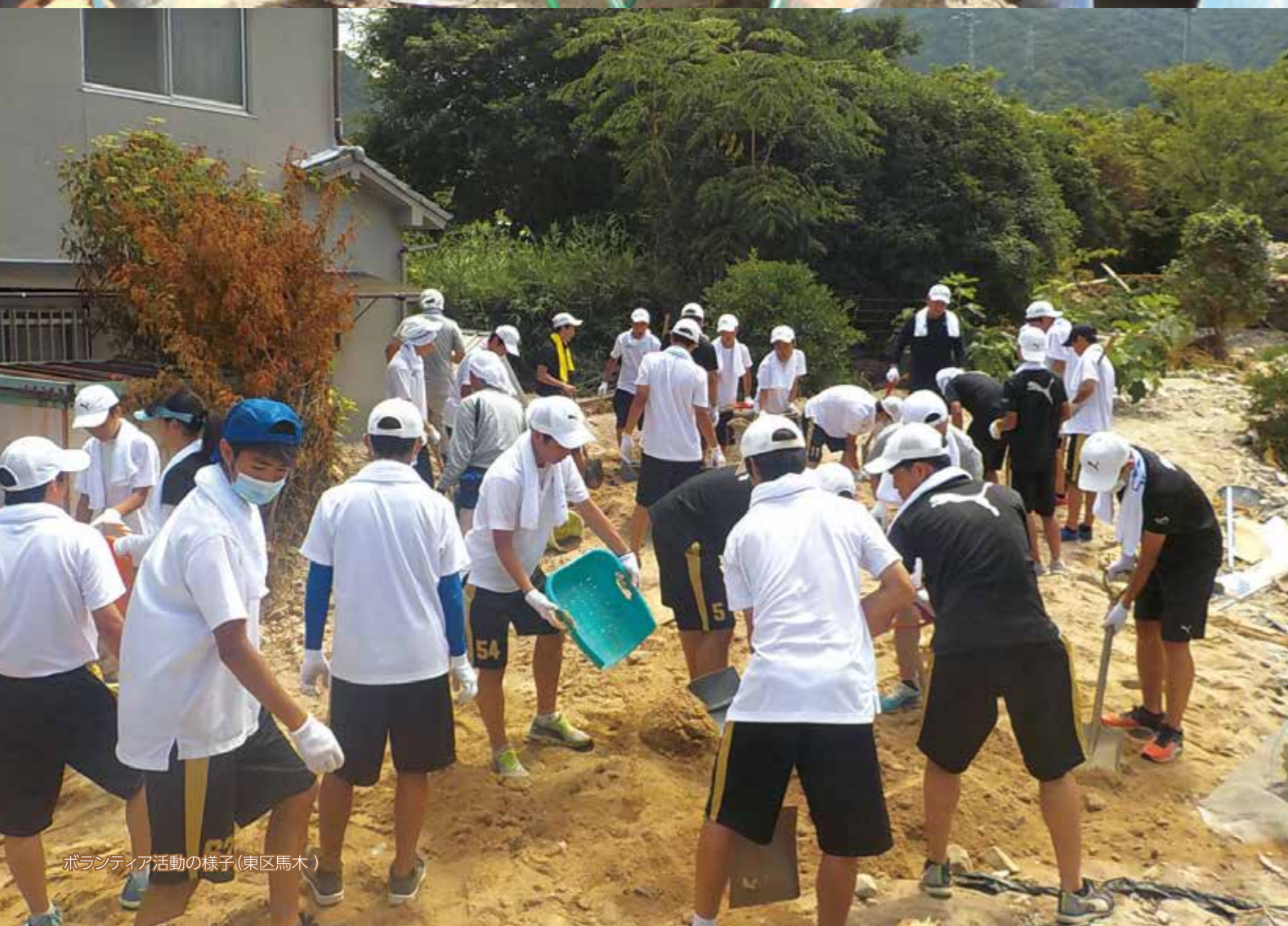
ボランティア活動の様子(東区馬木)