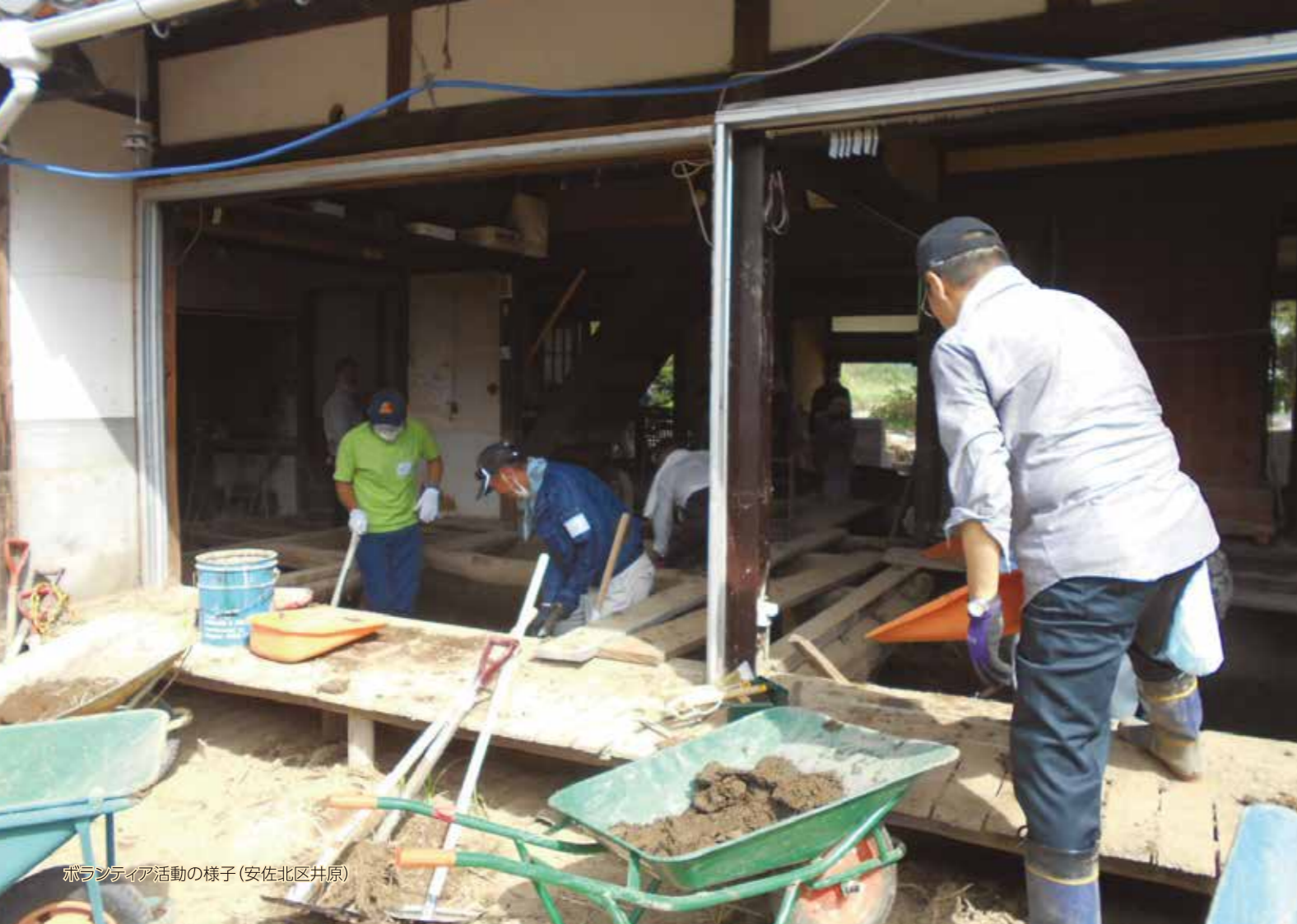
ボランティア活動の様子(安佐北区井原)