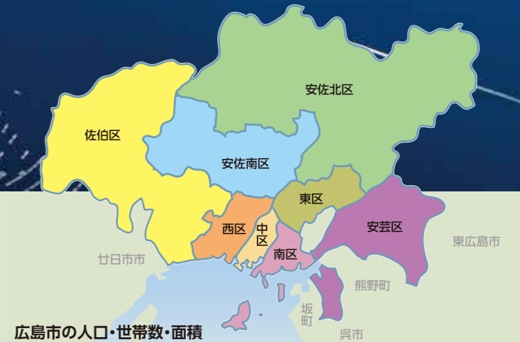
広島市の人口・世帯数・面積

気候は温暖で降水量が少ない、いわゆる「瀬戸内気候区」に属し、平年値(1981年～2010年)の月平均気温は、1月5.2℃、8月28.2℃、年平均16.3℃と比較的温暖である。降水量は南に豊後水道が開けている影響で、夏は南よりの風により集中的な豪雨をもたらすことがある。 市域は南北に約35km、東西に約50kmで呉市、東広島市、安芸高田市、廿日市市、熊野町、海田町、府中町、坂町、北広島町、安芸太田町と接する。また、広島湾を隔てて江田島市と隣接する。 中区、東区、南区、西区、安佐南区、安佐北区、安芸区、佐伯区の8つの行政区で構成されている。