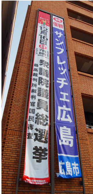
中区役所に掲出した懸垂幕