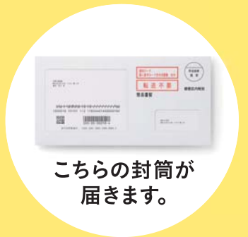
こちらの封筒が 届きます。

※10月5日時点の住民票に記載されている住所(居所を登録された方は当該居所)に届きます。