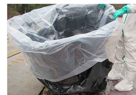
燃え殻を入れる2重の袋