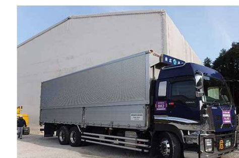
中間処理施設へ搬出