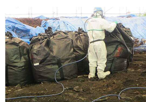
袋詰め作業(袋閉じ作業)