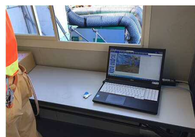
モニター室内のパソコン