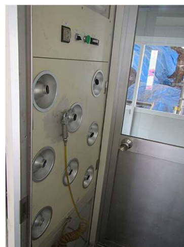
作業員の服等の粉じんを落とすためエアシャワー