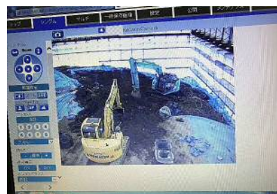
パソコン画面に作業状況を表示