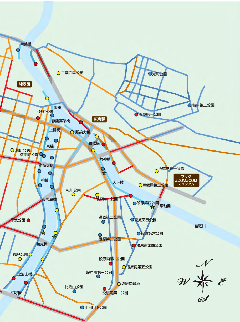
■美化推進区域・喫煙制限区域 (違反した場合、罰則が科される区域です。)

市街地周辺の道路沿いの不法投棄防止のため、夜間にパトロールを行っています、所有者のみでは対応が困難な大量の家庭ごみ等が捨てられている場所があります。