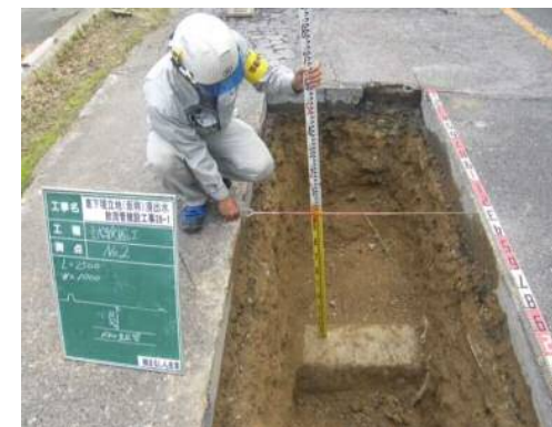
地下埋設管位置の確認