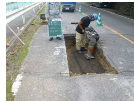
埋戻し締めめ状況

管布設に支障となる他の埋設物の有無を調査しました。掘削後の復旧は、大型車が通行しても問題ないように、入念に埋戻しを行った後、仮舗装を行いました。