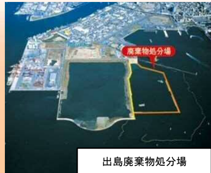
出島廃棄物処分場