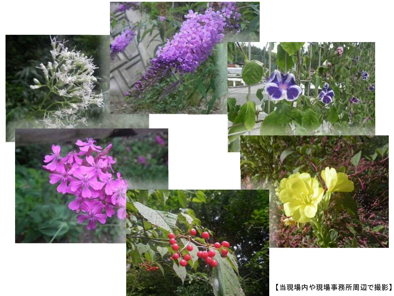
【当現場内や現場事務所周辺で撮影】