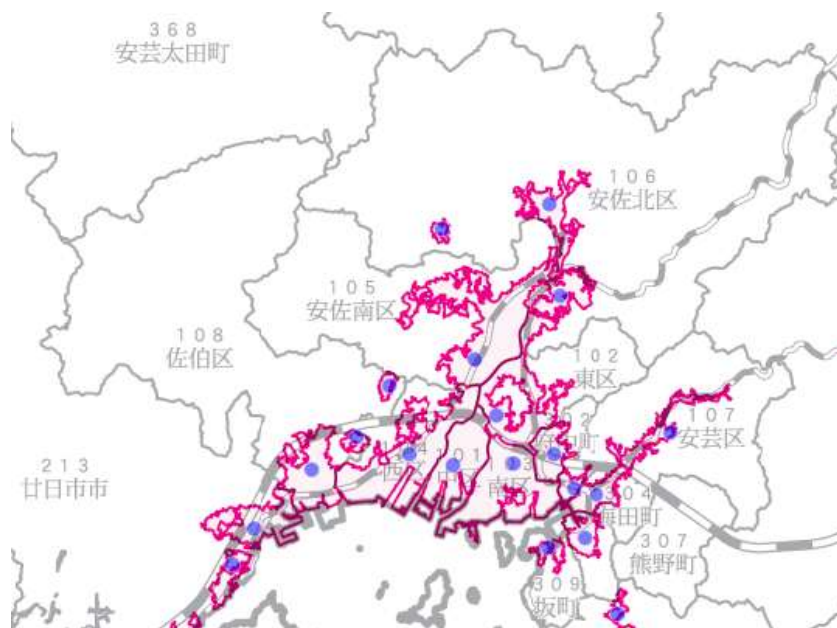
図1 人口集中地区（D I D）境界図（平成22年10月1日現在）

資料 総務省統計局「平成22年国勢調査人口集中地区境界図」 注 赤色の区域が人口集中地区（D I D）を示す。